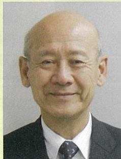
公益社団法人 広島被害者支援 センター理事長

貴センターの支援活動が充実したものとなり、広島県における被害者支援の取組がより一層推進されるよう祈念し、新年の挨拶とさせていただきます。