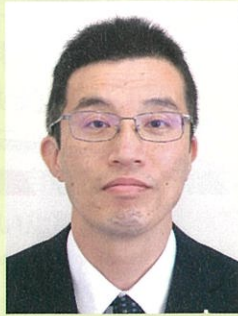
広島地方検察庁 総務部長