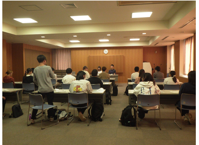
若手事務官（松山大学出身）との座談会の様子