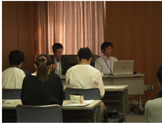
検察事務官による業務説明（刑事政策）の様子

10月12日（木）、松山大学法学部のゼミ生を当庁にお招きし、業務説明会を実施しました。