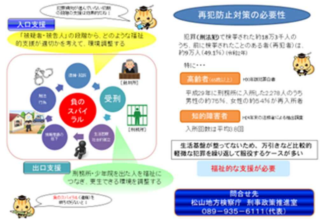
業務説明（刑事政策）で使用した資料②