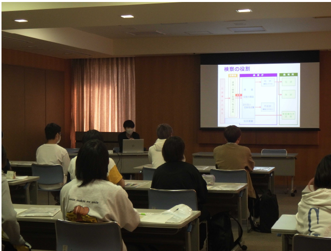
検察官による業務説明の様子