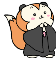
裁判所ナビゲーター 「さいたん」

広島高検・広島地検・広島法務局 広島高裁・広島地裁・広島家裁 広島弁護士会・法テラス広島 共催