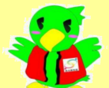
サイバンインコ (広報用キャラクター)